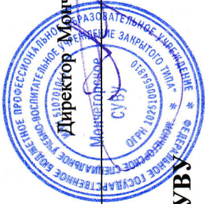
График учебно - производственного процесса Мончегорского СУВУ на II полугодие 2018- 2019 учебного года